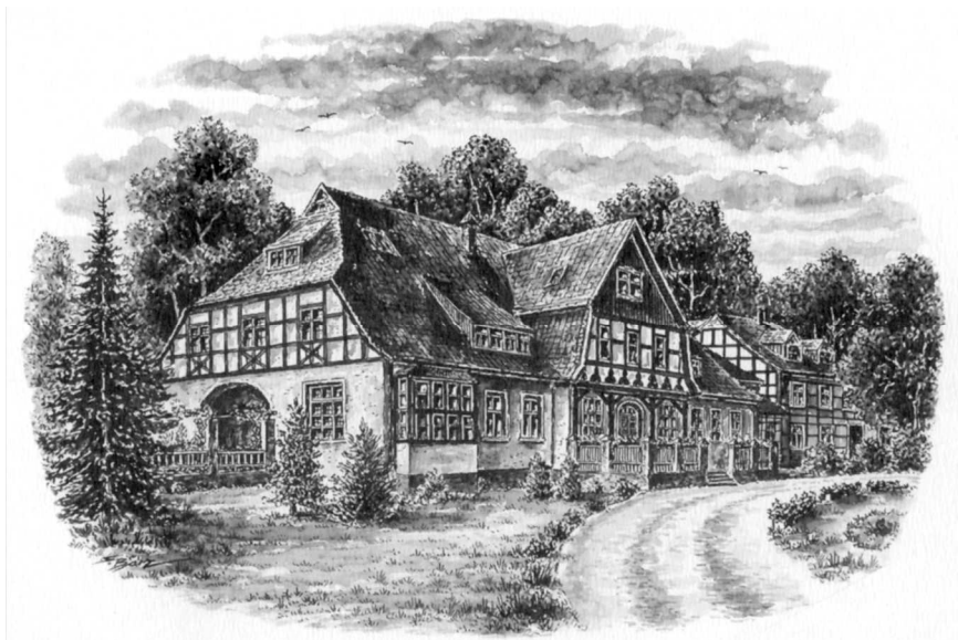
Ryc. 5. Zygfryd Barz, „Dworek osiecki”, odbitka z akwareli, 26 × 20 cm

Znacznie więcej informacji jest o artystach działających tu stale bądź czasowo po 1945 roku. Jednak powojenny Sianów w malarstwie i grafice wymaga osobnego opracowania.