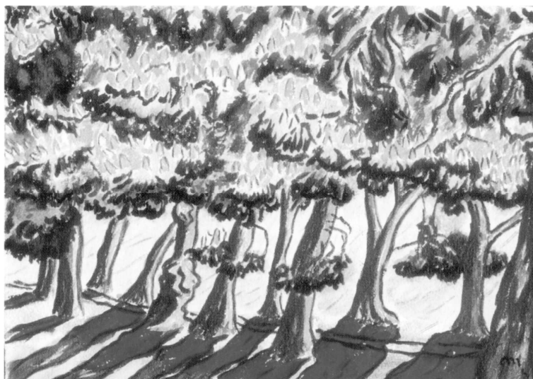
Ryc. 1. Günter Machemehl, „Aleja kasztanowa w Osiekach”, akwarela, papier, 1941, 76 × 56 cm, własność rodziny artysty

Jedna z ocalałych akwarel przedstawia „Aleję kasztanową w Osiekach” (ryc. 1).