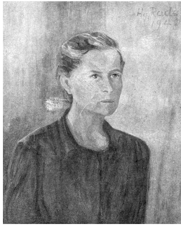
Ryc. 2. Hedwig Rades, „Autoportret”, olej, 1948

Okazały dom z przedłużonym balkonem usytuowanym nad sklepieniem i zwrócony ku jezioru spodobał się nam i wydał się tym przez nas poszukiwanym. Tak oto dotarliśmy do Hedwig Rades.